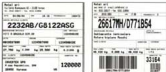
Immagini Etichette standard